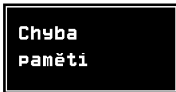
Obrázek 5: Varovné hlášení: Chyba paměti