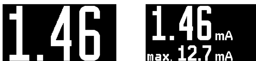
Obrázek 2: Režimy zobrazení měřené veličiny

Během probíhajícího měření se na displeji zobrazuje okamžitá hodnota měřené veličiny a případně i maximální hodnota. Volba se provádí v menu Nastavení přístroje.