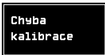
Obrázek 4: Varovné hlášení: Chyba kalibrace

Přístroj automaticky kontroluje správnost kalibračních konstant a dalších dat. Pokud dojde k jejich porušení (např. poškození paměti), zobrazí se na displeji chybové hlášení (Obrázek 4 nebo Obrázek 5) a nelze provádět měření. V tomto případě je nutné přístroj odeslat na opravu k výrobcí.