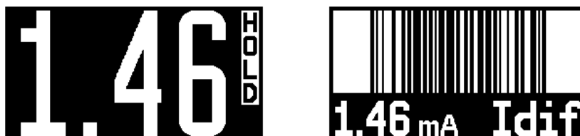
Obrázek 3: Režimy zobrazení zablokovaného údaje na displeji